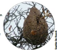
Sophie De Roubert

Nid de frelon asiatique : • Forme ovale • Entrée unique sur le côté